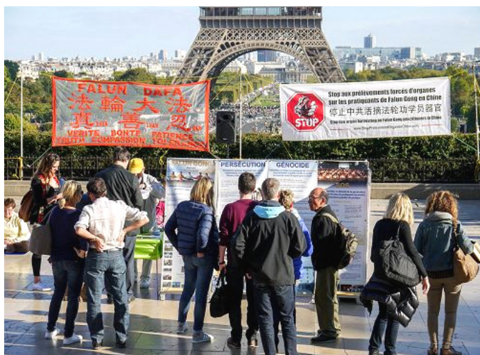
巴黎景点上，游客观看法轮功真相展板。

他又接着说：“你别说，法轮大法真是神奇，自从我在电话上听他们讲三退，我退出以后，念‘法轮大法好，真善忍好’，我就没病过，