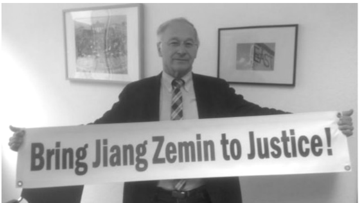
左：高雄市议会议长、议员和法轮功学员合影；右：德国联邦议会议员马丁·帕策尔特手举“法办江泽民！”的横幅