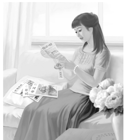
图：了解法轮功被迫害的真相

经神奇地消失了。在活生生的事实面前，大姨一家被大法的神奇与超常所折服！尤其是大姨父的态度来了个 180 度的大转弯，由开始抵触大法到如今赞叹大法、感恩师父。