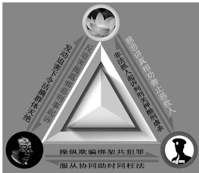
图：迫害与反迫害关系示意图

了几千年了，可是到了中共这不认这个理了。但是天理是无法被否认的。大量的事实就摆在面前。人做了善事、积了德就有福报；做了坏事、造了业就遭恶报。作为法官，如果能对杀人犯、投毒放火犯、拐卖妇女