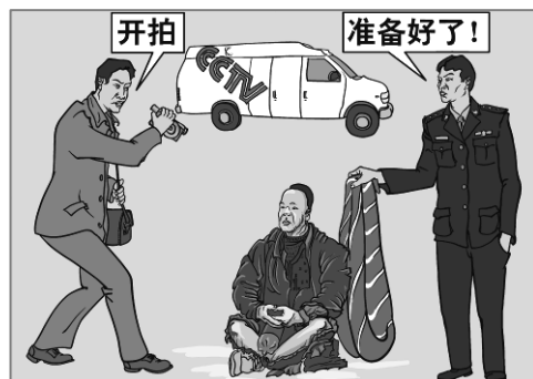
■ 中共为抹黑法轮功而导演了骗人的“天安门自焚”伪案。

邻居大哥是退伍军人，得了一种手脚都哆嗦的病，走路特别慢。一天，邻居大哥在后边喊我，我回头一看，大哥迈着大步、乐呵呵地向我走来，看来病好了。我问他：“护身符带上了吗？大哥说：“我把它放在我家最高处供起来了，我真得福报了。”◇