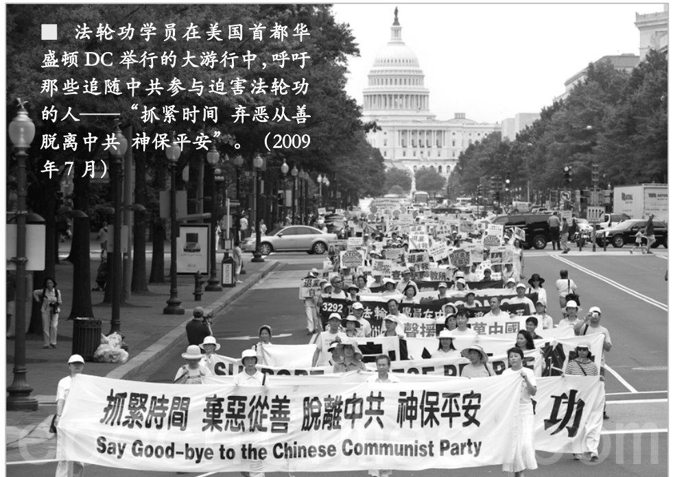
■ 法轮功学员在美国首都华盛顿 DC 举行的大游行中，呼吁那些追随中共参与迫害法轮功的人——“抓紧时间 弃恶从善 脱离中共 神保平安”。（2009年7月）

中共前党魁江泽民为迫害法轮功，于1999年6月10日专门成了“610办公室”这样一个法外机构。