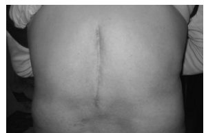
照片说明：大陆法轮功学员青岩康复后的后背照，可以看到，脊柱处的伤痕有15厘米。