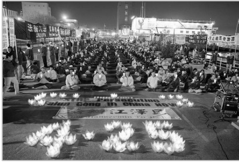
■ 海外法轮功学员纪念“4·25 和平上访”十七周年。（2016年4月）

多年对法轮功的迫害，没有动摇他们坚守“真善忍”的信念。他说：“这么好的功法，却不能让更多的中国人受益，让人痛惜。”