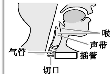
气管切开插管示意图

做气管切开手术，手术切口在声带的下方，此时人通过插入切口的管子呼吸，气流不过声带，根本无法正常说话。