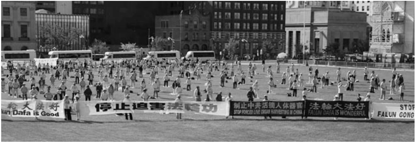
▲法轮功学员在加拿大国会山前炼功，并打出横幅，呼吁停止迫害。