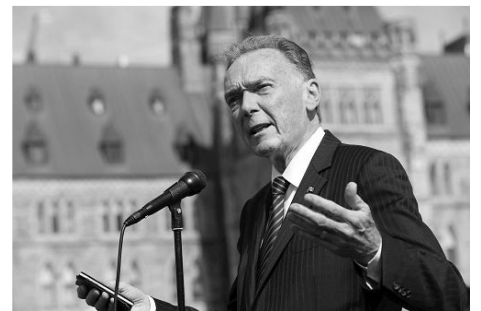
▲国会议员 Peter Kent 于九月二十二日现场支持法轮功，并在发言中敦促中国领导人法办江泽民。

和向中国民众讲法轮功被中共迫害的真相，都遭受过肉体和精神折磨。他们二零零四年就在加拿大以反人类罪控告了江泽民。