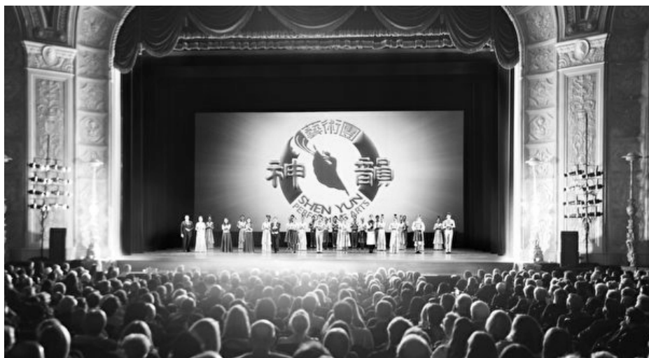
2016 年 12 月 26 日下午，底特律歌剧院内全场爆满的观众如潮的掌 声一次次响起，感谢神韵艺术团为他们带来的新年大礼。

如果有机会你能出国观看神韵 演出，也许你会发出由衷的感慨： 中国有希望了，历史上万国来朝的 荣景将重回神州大地。来生我愿再 做中国人。◇ 注：请访问神韵官方 网站 (www.shenyun.com) 查询最新 的演出日程和演出详情。