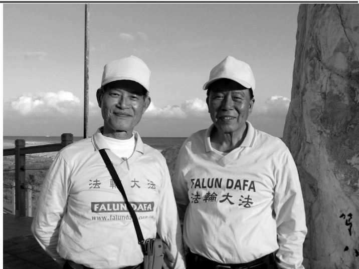
■ 林先生（右）和郑先生表示，修炼法轮功让他们明白了生命的意义

郑先生除了每天到景点，也坚持长期写信向大陆民众讲法轮功真相，他说：“我是自费做我应该要做的。”