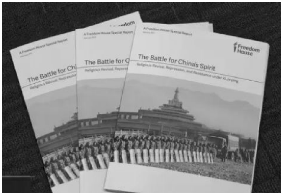
■ “自由之家”2017 年 2 月 28 日发布题为“中国的精神之战”的最新报告，详尽分析了中国的宗教自由的现状，各个宗教团体受干扰或迫害的程度。

虽然迫害法轮功政策没有官方改变，严重的大规模迫害还在继续，有的升级，法轮功学员被拘留、监禁、酷刑折磨，有的甚至被杀害；但另一方面，局部地区的迫害有所减轻。那些积极参与迫害的中共官员，如周永