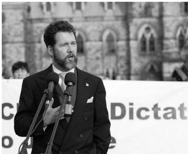
■ 加拿大国会议员 Scott Reid

【明慧网】法轮大法（又称法轮功）弘传二十五周年之际，加拿大法轮大法学会接到国会议员 Scott Reid 的贺信。Reid 议员在贺信中表示自己全力支持和声援法轮大法。