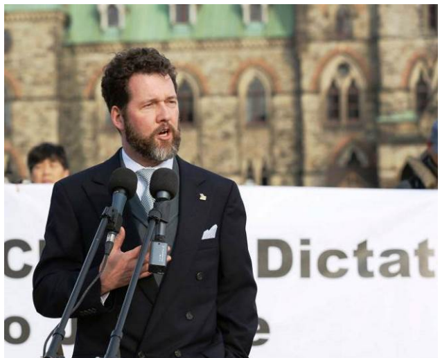
■ 加拿大国会议员 Scott Reid

【明慧网】法轮大法（又称法轮功）弘传二十五周年之际，加拿大法轮大法学会接到国会议员 Scott Reid 的贺信。Reid 议员在贺信中表示自己全力支持和声援法轮大法。