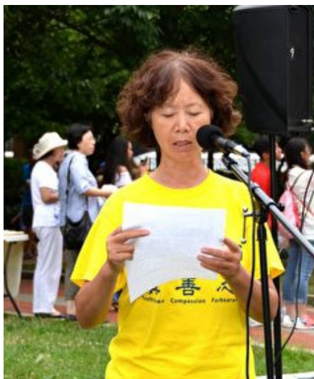
■ 来自安徽的沈女士由于修炼法轮功多次被中共当局非法关押，累计时间长达 11 年之久。

夜，凌晨 2 点才可以睡觉。我们还经常 24 小时不许睡觉，连续工作来完成沉重的工作量。我们全年只能休息 4 至 5 天。”