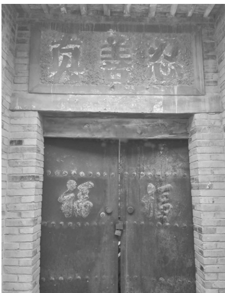
■图片：门匾上的“真善忍”

2012年，我退休后常回老家，发现了这个情况后，我立即把盖在“真善忍”三个字上面的白灰清理了，让“真善忍”三个大字又重新显现出来。我也给村干部及周围的人讲真相，讲自己的修炼体会，乡亲们认清了邪党的谎言，也知道了法轮功是