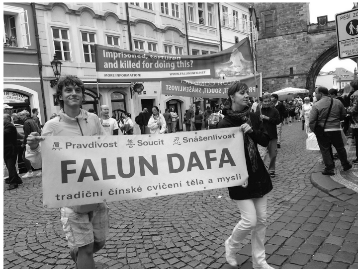
■ 法轮功游行队伍行进在布拉格街道

法轮功学员的游行队伍从瓦次拉夫广场出发，开始沿着布拉格最繁华、游客最多的街道和景点行进。捷克多家媒体，如捷通社，闪电，捷克周刊和宗教信息等，都对当天的布拉格集会游行的盛况进行了报道，并刊有多张照片。其中“宗教信息”媒体刊登了法轮功创始人李洪志先生的照片。