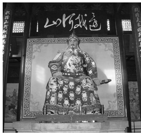
■杭州岳王庙里供奉的岳飞像

绍兴三十二年(公元1162年)六月,由于金国海陵王挥师南下,重新燃起灭亡南宋的战火,南宋军民抗金呼声不断高涨,出于无奈,赵构将皇位让给了自己的养子赵昚,即宋孝宗。宋孝宗是个抗战派,为了顺应民心,激励军民的抗金斗志,他继位的第二个月,就下诏给岳飞等人平反昭雪,官府悬赏五百贯白银,寻找岳飞的遗骨,准备以礼安葬岳飞。七月十三日官府贴出告示,八天后,隗顺的儿子探得皇榜确定无疑,才将父亲密葬岳飞的真实地点,报告了官府,从