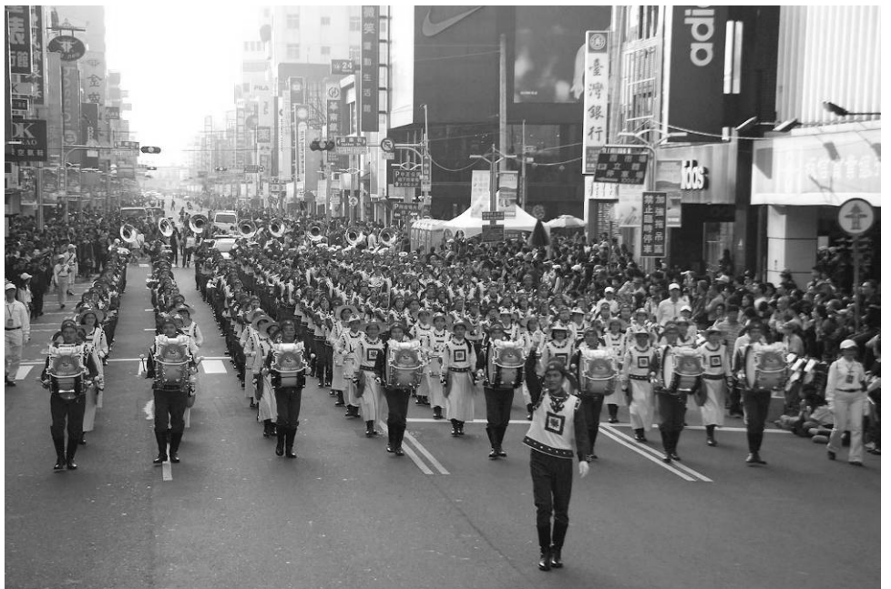
■参加国际管乐节踩街活动的台湾天国乐团

中山路是嘉义市商业荟萃的中心。乐团从中山路迈开脚步，奏出《法轮大法好》乐曲时，雄壮音乐震撼整条街道，吸引了民众的目光，沿路万人空巷，围观的群众望着天国乐团惊呼说：“这是最壮观的乐团。”