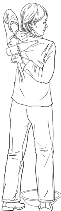
酷刑示意图：苏秦背剑