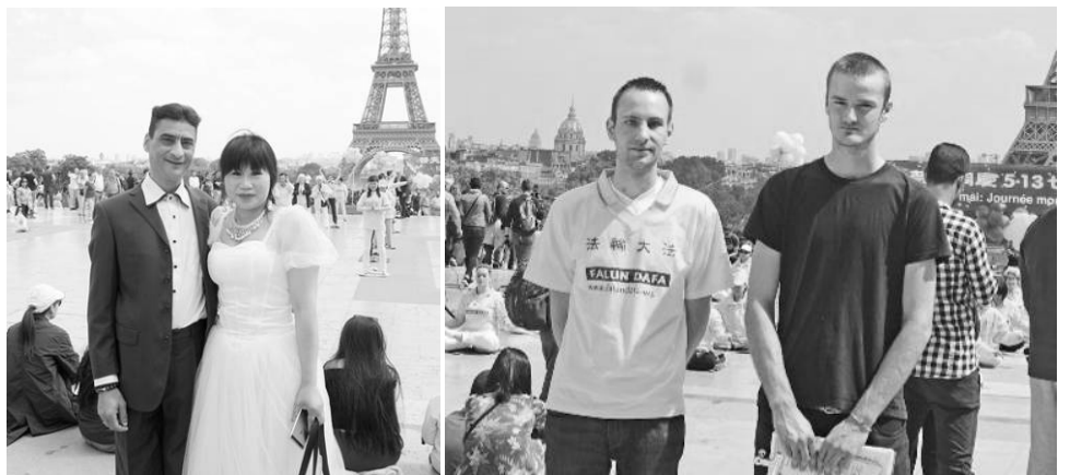
■上：法国法轮功学员在法国巴黎人权广场庆祝法轮大法日，演示功法。