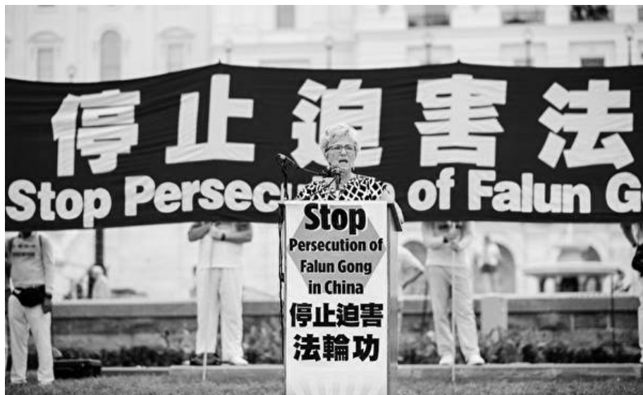
▲2018年6月20日，法轮功学员聚集在美国首府华盛顿DC，举行反迫害集会游行。美国国际宗教自由委员会副主席盖尔·曼钦在集会上发言。