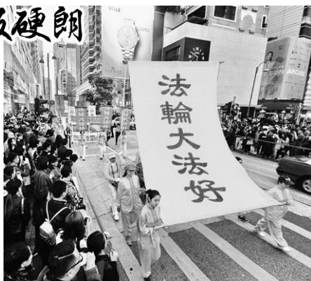
▲图为2016年1月2日香港法轮功学员新年大游行。大陆游客纷纷拿出手机、相机，争相拍照。

一天早上炼完功回家，我突然感到头部象抽筋、撕裂一样疼痛。想起师父讲过净化身体的现象，我明白了：这是师父在给我调整身体呢。很神奇，刚这样一想，只过了两、三分钟，疼痛就消失了。