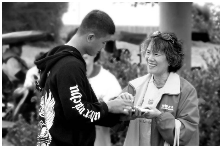
◀台湾法轮功学员在向游客讲法轮功真相。

一位从广州来游玩的大陆游客说：“不论到哪个国家游玩或出差，都会看到炼法轮功的人。”同时表示很钦佩法轮功学员们的精神。他还说：“希望快点平反法轮