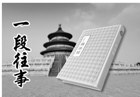
▲1999 年中共江泽民禁止法轮功书籍出版的禁令，已于 2011 年 3 月被废除。

领头的警察把头一摆，上来 4 个年轻警察，抢夺我手上的钥匙。我攥得紧紧的，他们掰不开我的手，就把我按倒在地，按腿的按