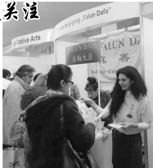
▲民众驻足法轮功真相摊位前了解法轮功

民众反馈，炼功时感受到祥和、宁静。一位女士表示，她感到学员们炼功时，有一种强大的能量场包围着她，她说自己一定要到炼功点跟大家一起学。很多人在看到功法展示后，特意去展位咨询怎样开始学炼、购买法轮功书籍，并了解法轮功被中共迫害的真相。整个3天的博览会，近万人拿到了法轮功资料。◇