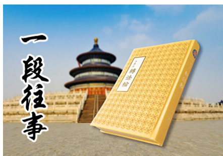
▲1999 年中共江泽民禁止法轮功书籍出版的禁令，已于 2011 年 3 月被废除。

领头的警察把头一摆，上来 4 个年轻警察，抢夺我手上的钥匙。我攥得紧紧的，他们掰不开我的手，就把我按倒在地，按腿的按