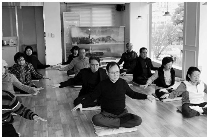
▲韩国天梯书店里，新学员在学炼法轮功第五套功法

一天早晨，他在富平公园里运动，看到一名女法轮功学员独自在炼功。“从那里我感受到了很强烈的能量，同时，感到她的炼功动作比跳舞还