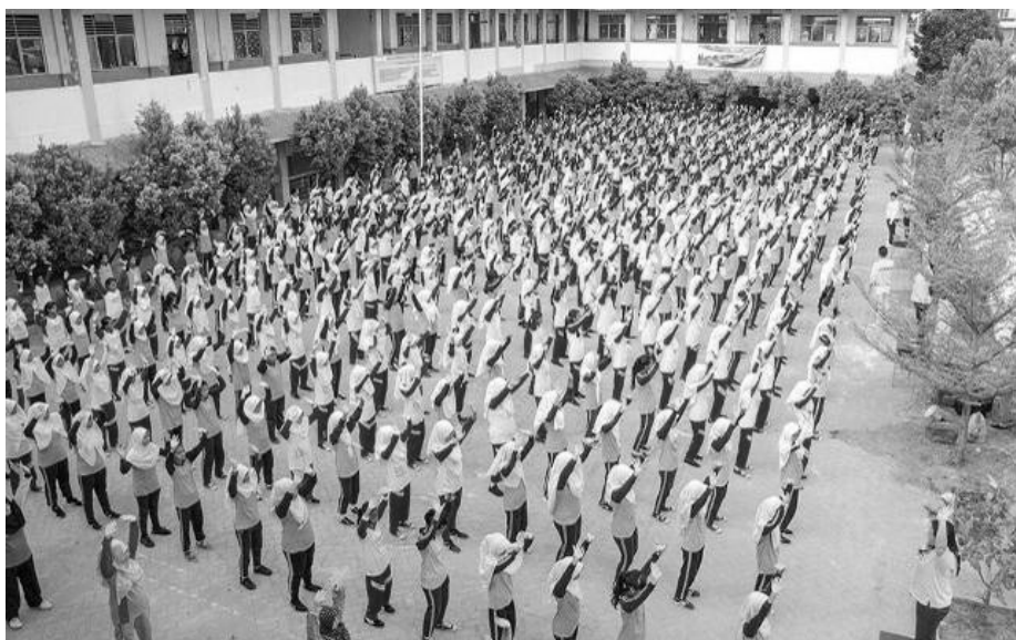
▲印尼巴丹岛第三十八国立中学大约五百名师生、工友集体学炼法轮功

炼完功后，校长表示：“音乐与动作能帮人集中注意力，身体部分特别是腰、关节、后背感到舒服。”艺术老师说：“当专注于音乐时，闭着眼感受到光。我的小臂受过伤，通常很难把它抬高，但在炼第四套功法时我能抬小臂过头，很奇妙！”◇