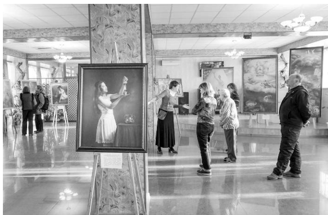
▲“真、善、忍国际美展”在俄罗斯五山城举行