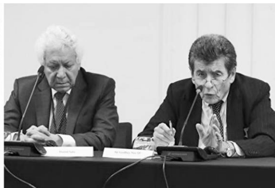
▲左图：芬兰国会大厦；右图：伦敦“独立人民法庭”法律顾问 Hamid Sabi（左）和法庭主席尼斯爵士

国际法庭主导对塞尔维亚前总统斯洛博丹·米洛舍维奇的审判。预计独立法庭将于今年春天作出最后判决，届时犯罪者更多的罪行将曝光于天下。