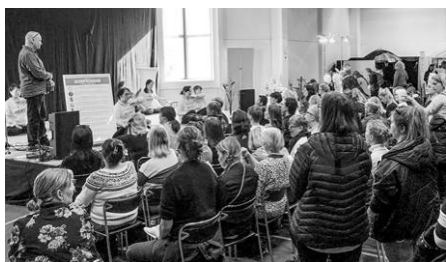
▲展会期间，法轮功学员在展览大厅舞台上演示法轮功第五套功法。

最后，信中说：“作为芬兰议会议员，我们认为，在大量证据面前，加上独立医疗专业人士和国际法律专家的介入，我们不能漠视这些证据，我们不能将它们视为谣言或宣传。因此，我们呼吁中共当局进行调查，并采取必要措施，将那些被证实参与这些罪行的组织或个人绳之以法。”◇