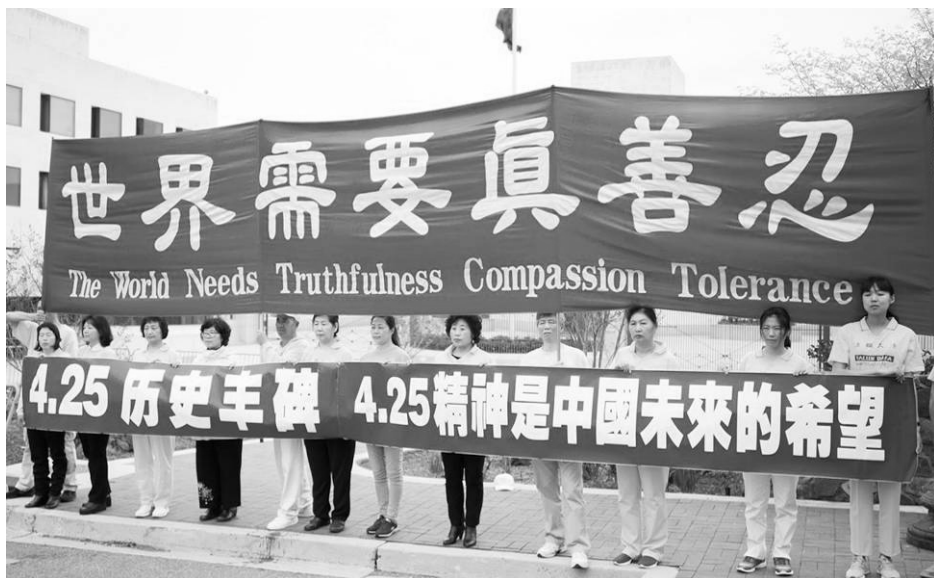
▲纪念“4.25”和平上访 20 周年集会现场

参加了“4.25”上访的章先生通过电话连线在集会上发言。他说：“从‘4.25’这个事件中，我们看到了一种精神，就是一种不计个人得失、敢于坚持原则的精神。