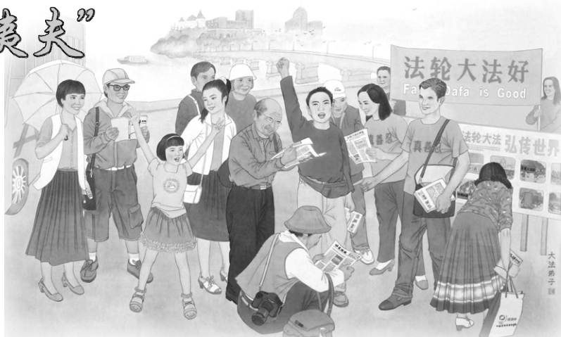
◀绘画：明白真相的人们高呼“法轮大法好”