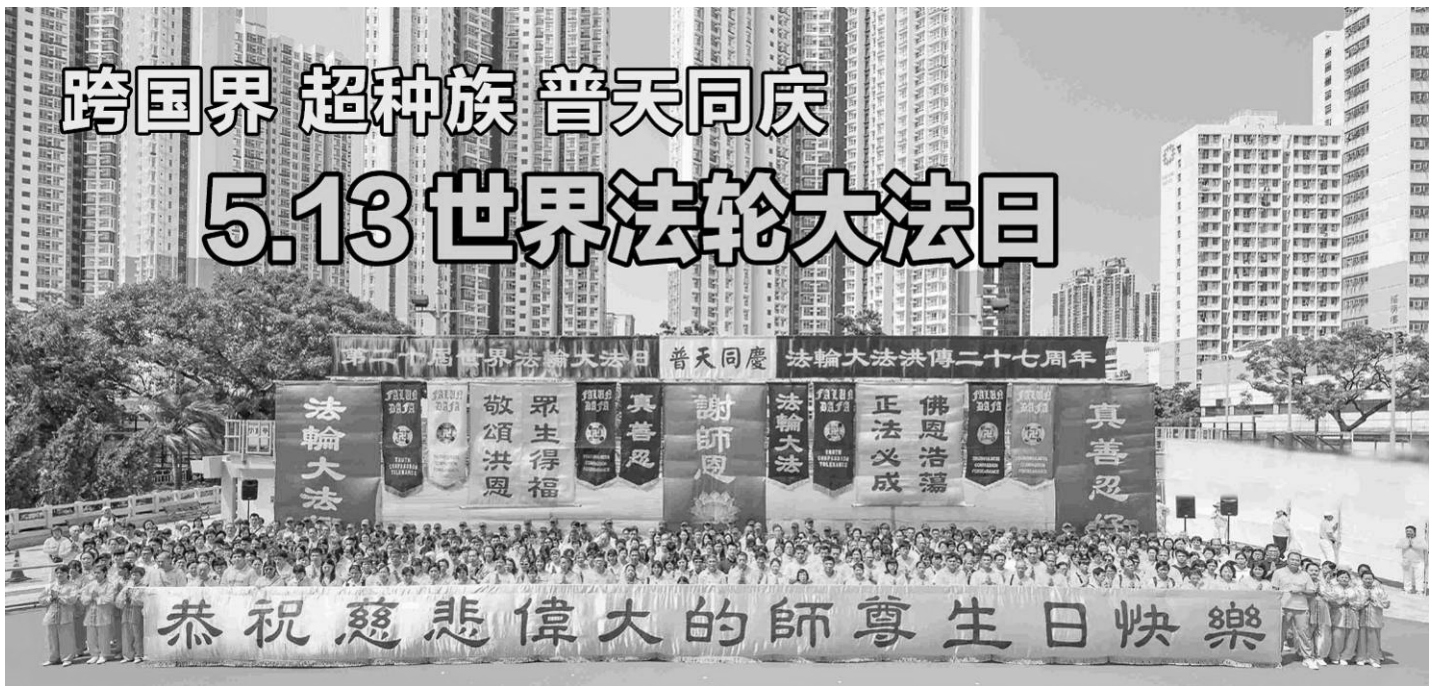
▲5月12日，香港法轮功学员举办盛大的集会游行，敬谢师恩，并向民众传扬“法轮大法好，真善忍好”的福音。