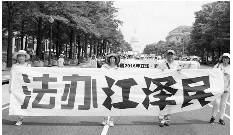
▲1999 年 7 月 20 日，中共前党魁江泽民祸国殃民，发动了对法轮功学员的残酷迫害，其罪行必将被清算。

1998 年，江泽民在一次洪灾期间外出视察，在一处大堤看到一群人在埋头苦干。江很得意，对随行的人说：这些人一定是共产党员。不料，经过询问，原来他们都是炼法轮功的。江泽民听到答复后，阴着脸掉头走开了。