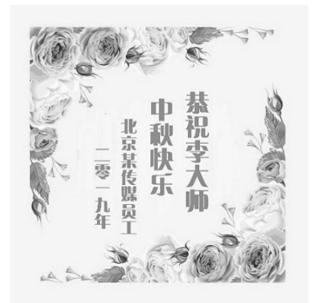
▲北京某传媒员工中秋贺卡

我们员工中,有结婚数年没有孩子,因为退出中共党团组织后,喜得贵子的;有家属出差在宾馆触电,默念“法轮大法好”遇难呈祥的;有出车遇到劫匪,默念“法轮大法好”平安无事的;有采访夜归,遇到抢手机的,默念“法轮大法好”劫匪吓跑的;有刹车失灵,默念“法轮大法