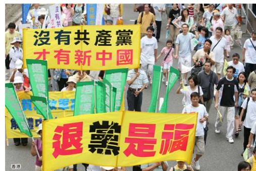
▲截至2019年9月退出中共邪党组织（党、团、队）总人数已突破3.4亿。图为海外华人游行中的退党横幅。

干完活临走的那天，书记不在，我问他妻子书记退党的事，她说翻墙看到外面的世界好惊奇啊，书记用真名退的，因他的名字是个大众化的名字，上网一查好多同名的人呢。她说，以后我们亲戚来，我们都给他们这样办理“三退”。我说：“恭喜你们三退保了未来平安。”◇