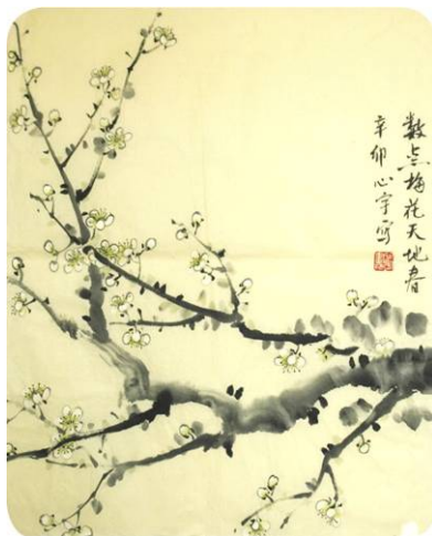
水墨画：数点梅花天地春

还有一个大法弟子把仅有的一盒饼干送给一个死刑犯，那个曾经在社会上混的、遇到刀枪都不眨眼的男儿，放风时路过女牢房时流下了眼泪说：“姐，这么多年我是第一次接到别人给我东西，以前都是别人从我这拿。我没进来前要是学了法轮大法，我不会犯罪，我会永远记住法轮大法好的。如果有来生我一定学大法。”后来他是一路上