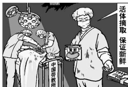
时事漫画：罪恶的交易