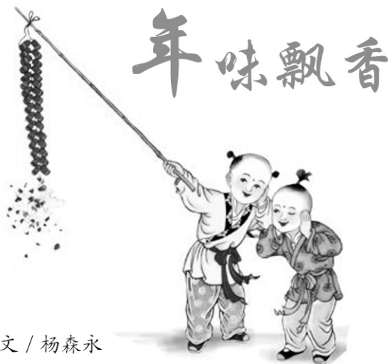
文 / 杨森永

孩提时期最丰满的记忆中，最期盼的就是过年了，因为那样就可以有新衣服穿，有肉吃，还可以不用担心到处玩了以后被骂，更不用