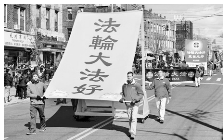
▲海外法轮功学员游行中的巨型横幅

记得第一次我要他们一起小声朗读时，他们却大声读出声来，几乎整栋教学楼都听到了。反正全校师生都知道我是法轮功学员，我也不管了。有些我教过的学生或没任教的学生，校园内外见到我时，不喊“老师好”，而是喊：“法轮大法好”。十几年来，一直都有。