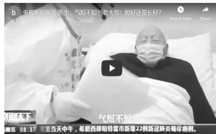
▲ 央视新闻画面——医生：气短不短？老大爷：短好还是长好？

其实，所谓“天安门自焚”，就是中共自导自演的骗局。法轮功书籍中明确指出杀生和自杀都是有罪的，真正的修炼人绝不会杀生或自杀、自焚的。◇