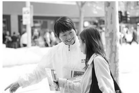
▲法轮功学员常年坚持在街头向路人讲述法轮功的真相

媒体的报导与法轮功学员每年数次在香港的大游行、及在各景点的讲真相，早已让全香港都知道中共活摘器官的事，但不少香港人因不了解中共的邪恶本质，多年来