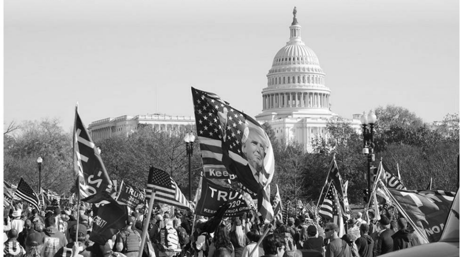
▲2020 年 11 月 14 日，数十万民众来到首都华盛顿参加支持川普总统的大游行。

泱泱大国，舞弊乱象，令人匪夷所思，不但重创了自由世界引以为傲的宪政民主、践踏了人类文明和道德底线，更预兆着美国面临危急的未来：左派代理人倘若真的“窃取”了美国大选，美国和世界将被邪恶社会主义侵蚀并拖入深渊。