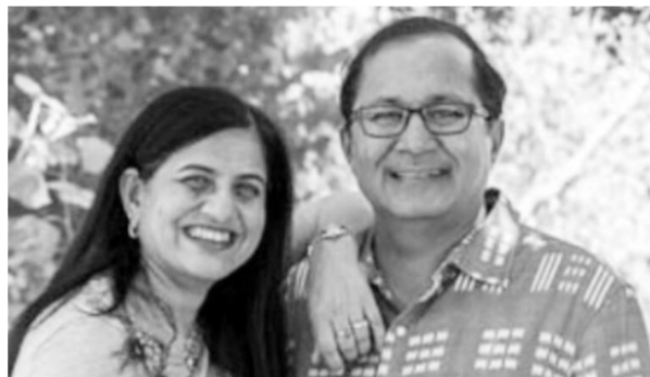
印度裔 医学博士帕蒂 夫妇

一扇门即将关上的时候，可能是另一扇门的开启。人的肉身脱离我们这个物质世界后会去哪里？在美国，每年约有20万人经历过濒死体验，也许他们的故事能给后人有所启示。