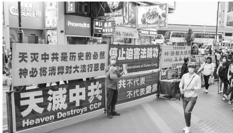
◀ 香港法轮功学员坚持传递真相，一天都没有停止过。

“共产党大言不惭说接受人民监督，人民一监督就是寻衅滋事了。最近中共逼着我们表明态度，这‘党员之家’的牌子都发我家了。我声明‘三退’（退出中国党团队），不是为了出国方便，是因为我爱中国。中共就是马列邪教寄生在中华大地的害虫。”◇