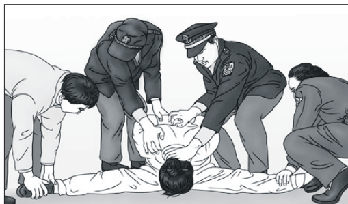
▲中共酷刑示意图：左：沸水烫； 右：超过生理极限的“劈腿”

【明慧网】据明慧网报道，二零二一年一月至三月，28名法轮功学员被中共迫害离世。其中16名法轮功学员长期在中共监狱非法关押期间被迫害致死，八名在看守所非法关押期间致死，两名在派出所非法关押期间致死，一名在村委会非法关押期间被活活打死。