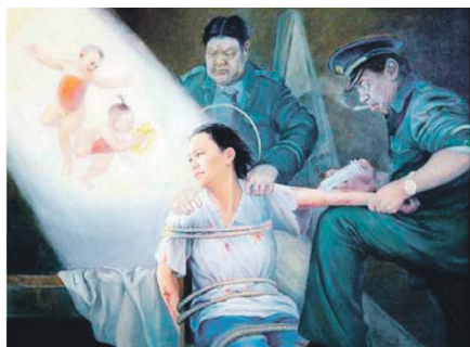
▲酷刑演示：打毒针（绘画）

“药物被灌入肚子后，片刻就会感到全身难受、恶心、呕吐、头昏眼花。……全身发痒、烦躁不安，感觉象颗炸弹要把脑袋炸开……。”