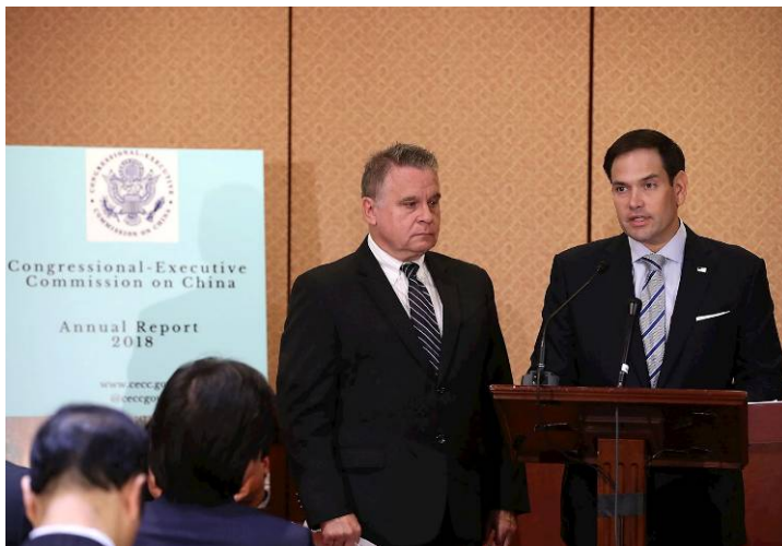
■十月十日，美国联邦参议员、“美国国会及行政当局中国委员会”主席卢比奥（右）和“美国国会及行政当局中国委员会”共同主席史密斯公布美国会人权报告

非政府组织“对华基金会”在中共司法数据库中发现，二零一七年有八百人被判刑，其中大部份是法轮功学员。报告说，中共当局继续使用法律之外的行政手段进行任意拘禁。中共继续使用“利用×教破坏法律实