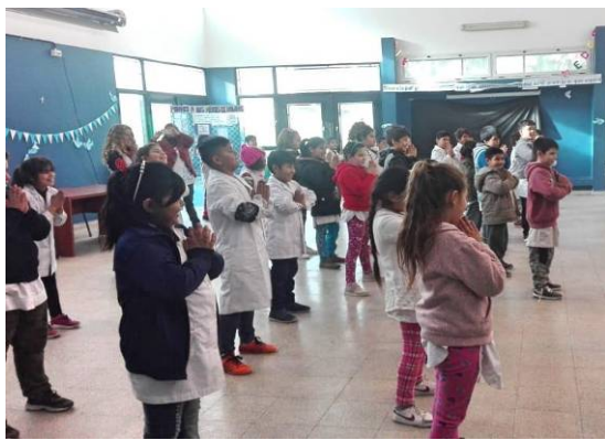
■二零一八年七月十三日，布宜诺斯艾利斯法轮功学员在索拉诺镇的一所学校教授孩子们法轮功功法。

阿根廷首都所在的布宜诺斯艾利斯省的索拉诺镇一所学校的校长，不久前参加了省文化和教育单位的教师和负责人的培训。该培训旨在让全省五十个学区的两千所学校自愿联合起来，共同合作，改善学生的学习。培训中播出了乌拉圭一所学校如何从法轮功