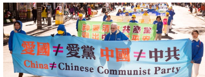
■游行队伍中，法轮功学员打出的条幅信息，让越来越多的华人清醒，“爱国≠爱党、中国≠中共”。

这几年，在中共官场的剧烈动荡中，多名“吉林帮”高官落马，如：原吉林省省长、省委书记王珉被判处无期徒刑；吉林省副省长谷春立被判 12 年；原吉林省副省长李晋修被责令辞职，等等。这些落马高官都有一个共同的特点，他们都是积极追随江泽民迫害法轮功的残酷凶手。◇