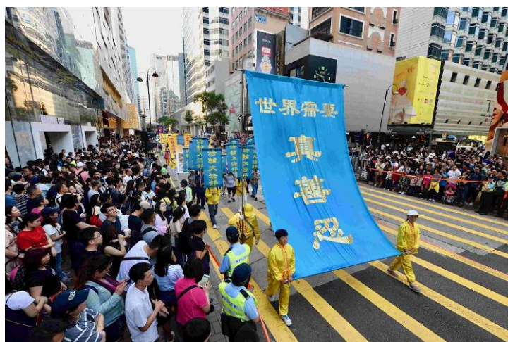
游行传播福音：世界需要真善忍。

【明慧网】2018年10月1日，香港法轮功学员举办盛大的反迫害集会游行，呼吁制止中共迫害，法办迫害元凶，同时声援中华儿女退出中共党、团、队，促成和平解体中共。多位政要名人在集会上、或通过录音发言声援法轮功，表示敬佩法轮功学员长达19年反迫害的精神，同时谴责中共暴政，呼吁各界共同努力，让没有共产党的美好新中国