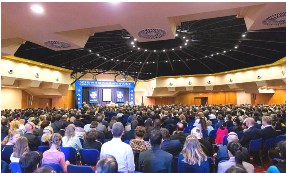
■二零一八年欧洲法轮大法修炼心得交流会九月二十九日在欧洲古城布拉格隆重召开。图为交流会会场。

法会结束后，法轮功学员集体阅读《转法轮》（法轮功指导修炼的主要书籍），由20位学员以20种不同的语言，领着大家一人一段，轮流读《转法轮》。整个会场里，20种语言在读同一本书。不同种族文化语言的学员，心里发出同一个声音：“法轮大法好”、“真、善、忍好”。◇