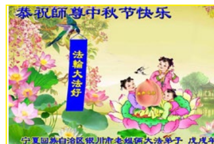
中国大陆民众的贺卡