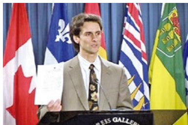
▲ 2004年2月5日，乔·契布卡在加拿大国会召开新闻发布会，说明他状告中共官员获得胜诉。

我今年五十岁了，我明白了真正的答案来自内心。法轮功帮助我获得了我想像中最深奥的内在的祥和。我的安宁不再取决于