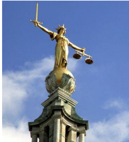
■ 伦敦老贝利大楼屋顶上的正义女神雕像

“独立人民法庭”是在“终止中共移植滥用国际联盟（ETAC）”的倡议下成立的。ETAC 的主席温迪·罗杰斯教授说：“要解决这样大规模的犯罪问题，国际社会需要