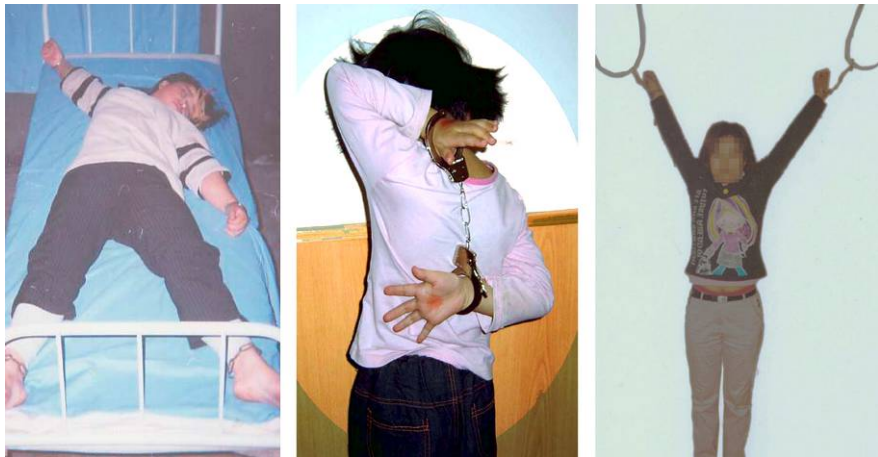
■酷刑演示：左：长时间铐在床上，又称死人床；中：背铐，睡觉也不给打开；右：上大挂，两手吊铐起来，脚不沾地。