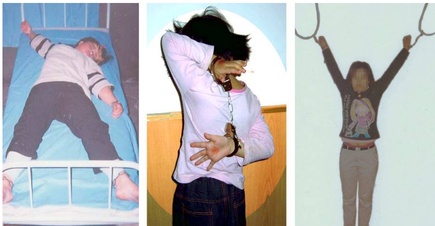
■酷刑演示：左：长时间铐在床上，又称死人床；中：背铐，睡觉也不给打开；右：上大挂，两手吊铐起来，脚不沾地。