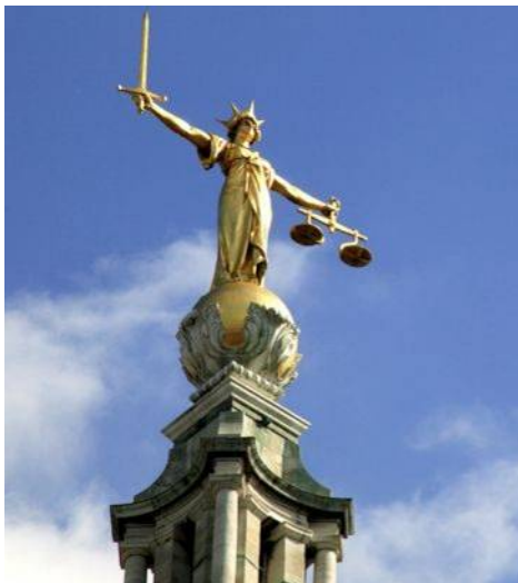
■ 런던 베일리 빌딩의 지붕위의 정의 여신 동상