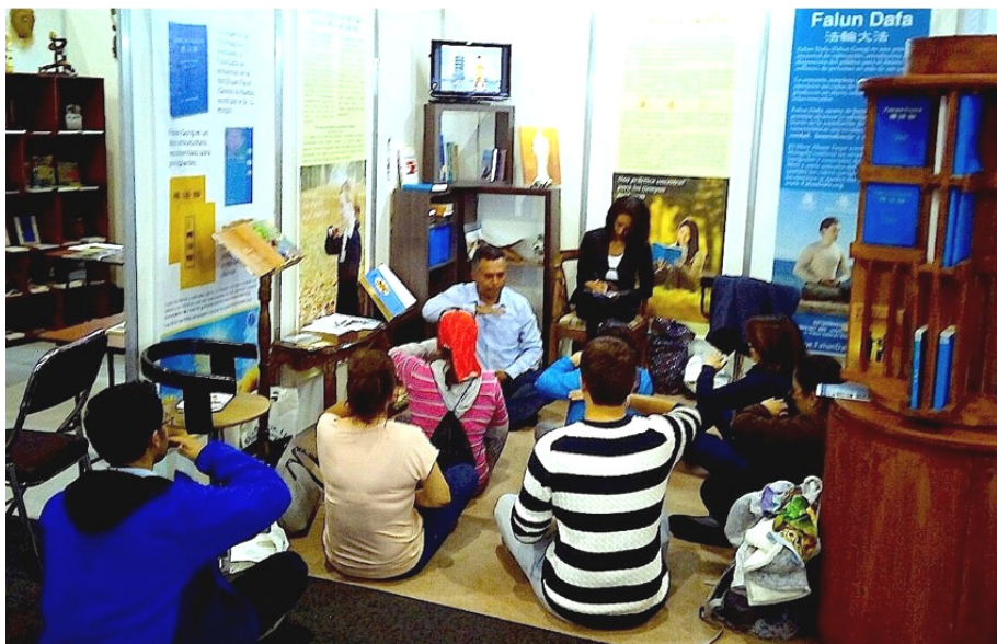
■在书展上，络绎不绝的人群来到法轮功展台参观学炼功法

来到法轮功展台，炼完功后，他告诉学员：“我过来的时候，就看见法轮功展台有能量在转动，这种机会可遇而不可求，所以我马上学炼功法。我近几年一直在寻找修炼的机缘，非常感谢你们！”