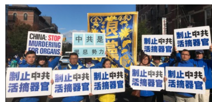
▲10 月 21 日纽约法轮功学员在社区，曝光中共绑架韩冰等的罪行。打出“中共是黑恶势力”、“制止中共活摘器官”、“退党”等展板。

韩冰一直被非法关押在第四看守所，八月初，家人通过出狱的狱友得知，韩冰在七月末遭非法庭审过。家属曾打电话给朝阳区法院询问开庭时间，何姓院长说：开庭不通知家属。法官陈晓静负责此案。◇