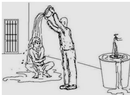
■吉林监狱酷刑图：用凉水浇冻